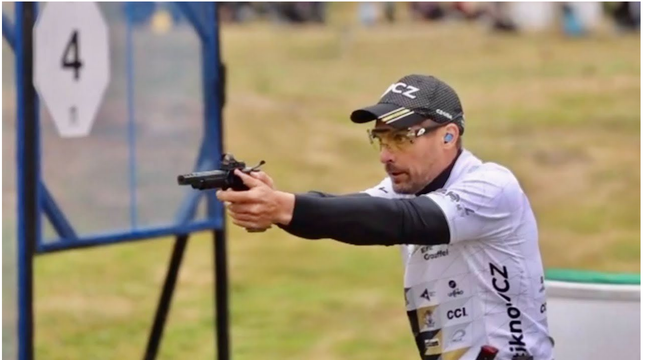
Eric Gaufrel, 9 fois champion du monde

Cette discipline propose de tirer contre la montre avec des pistolets de calibre 9 millimètres et plus, munis ou non d'une visée optique. L'arme est portée dans un étui (holster) placé à la ceinture.